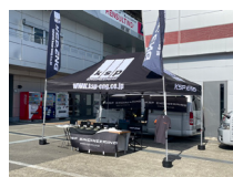
ケイエスピーエンジニアリング