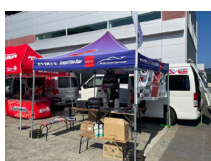
エイチ・ピー・アイ