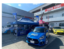
エンドレスアドバンス