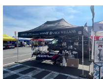
アサヒカゼ FET 事業部

第 39 回 NAPAC 走行会の開催にご協力頂きました関係各位に御礼申し上げますとともに、次回もどうぞよろしくお願い申し上げます。