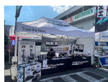
エッチ・ケー・エス