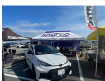
エンパイヤ自動車