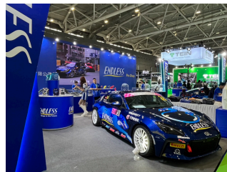
エンドレスアドバンス