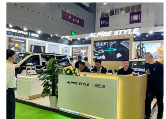
ニュース（アルパインスタイル）